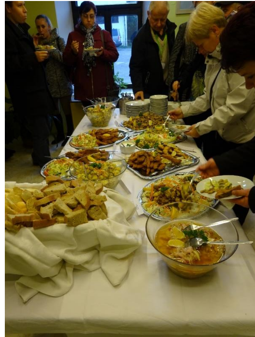
Rybniční hospodářství s. r. o. - rybí raut z čerstvých místních ryb

MAS Bohdanečsko se v průběhu roku účastnila několika místních akcí ve spolupráci s městem Lázně Bohdaneč. Pracovníci kanceláře MAS se v roce 2017 prezentovali na těchto akcích: Dětský den, Loučení s létem a Výlov Bohdanečského rybníka. Prezentace MAS slouží k informování o činnosti v území, možnostech spolupráce a vyhlašování výzev, v rámci kterých, je možno čerpat přes MAS finanční prostředky. Pro prezentaci své činnosti zrealizovala MAS Bohdanečsko v roce 2017 tvorbu a tisk následujících propagačních materiálů: cykloturistická mapa, 6 témat o Bohdanečsku a pracovní sešit pro děti mladšího školního věku s úkoly.