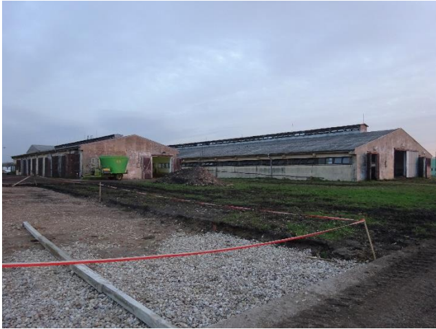
AGD Klas – velkokapacitní kravín v Dolanech