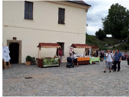
Festival chutí, vůní a řemesel, Pardubický Zámek, 12. 8. 2017