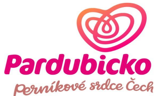
Logo Pardubicko - Perníkové srdce Čech, z. s.

MAS Bohdanečsko se v průběhu roku účastnila několika místních akcí ve spolupráci s městem Lázně Bohdaneč. Pracovníci kanceláře MAS se v roce 2017 prezentovali na těchto akcích: Dětský den, Loučení s létem a Výlov Bohdanečského rybníka. Prezentace MAS slouží k informování o činnosti v území, možnostech spolupráce a vyhlašování výzev, v rámci kterých, je možno čerpat přes MAS finanční prostředky. Pro prezentaci své činnosti zrealizovala MAS Bohdanečsko v roce 2017 tvorbu a tisk následujících propagačních materiálů: cykloturistická mapa, 6 témat o Bohdanečsku a pracovní sešit pro děti mladšího školního věku s úkoly.