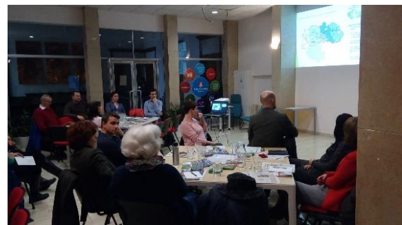
Setkání regionálních výrobců Kraje Pernštejnů Kulturní centrum Pardubice, 21. 2. 2017

MAS Bohdanečsko spolupracuje se sousedními regiony MAS Region Kunětické hory (MAS RKH), MAS Holicko v projektu regionálního značení KRAJ PERNŠTEJNŮ regionální produkt®. Cílem projektu, jehož hlavním koordinátorem je MAS RKH, je podpora odbytu místních producentů a vyzdvižení kvality jejich výrobků. Právo užívat značku Kraj Pernštejnů regionální produkt bylo na základě dosud proběhlých