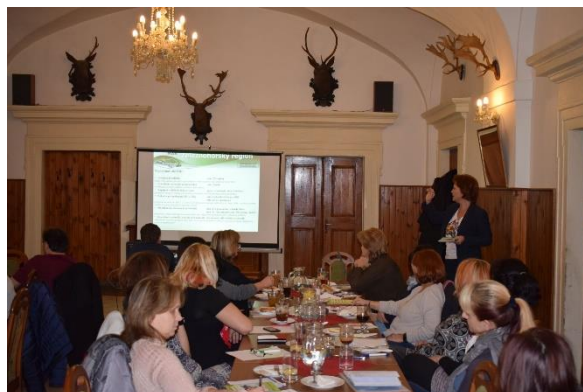
Jednání pracovní skupiny MAP ORP Přelouč v Cholticích

MAS Bohdanečsko byla v roce 2017 i nadále zapojena do zpracování Místních akčních plánů rozvoje vzdělávání (MAP). Jedná se o strategické dokumenty pro oblast školství, které se intenzivně zpracovávaly již v průběhu roku 2016 na úrovni ORP (ORP Pardubice a ORP Přelouč). MAS Bohdanečsko se podílela na zpracování MAP u mateřských a základních škol z území MAS Bohdanečsko formou administrativní podpory hlavních realizátorů MAP. Manažerka MAS je členem Řídícího výboru MAP v ORP Přelouč a plní funkci odborného garanta spolupráce v MAP ORP Pardubice. Tvorba Místních akčních plánů je podmínkou pro čerpání financí z Integrovaného regionálního operačního programu. Veškeré investiční projektové záměry škol musí být zaneseny v tzv. Strategickém rámci MAP. Místní akční plán ORP Přelouč byl ukončen k 30.6.2017 a od podzimu roku 2017 probíhaly přípravy na podání žádosti do MAP II. V rámci tvorby MAP ORP Přelouč a MAP ORP Pardubice probíhaly v průběhu roku 2017 pravidelná setkávání pracovních skupin, vzdělávací semináře pro ředitele a učitele škol a jednání Řídícího výboru. Pracovníci MAS se těchto setkávání pravidelně účastnili a ve spolupráci budou pokračovat i v nadcházejícím roce při zpracování MAPŮ II.