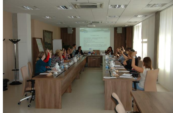
Obr. 7 Jednání Řídícího výboru MAP Přelouč, 22. 9. 2016

MAS Bohdanečsko byla v roce 2016 zapojena do zpracování Místních akčních plánů rozvoje vzdělávání (MAP). Jedná se o strategické dokumenty pro oblast školství, které se v průběhu roku 2016 intenzivně zpracovávaly na úrovni ORP (ORP Pardubice a ORP Přelouč). MAS Bohdanečsko se podílela na zpracování MAP u mateřských a základních škol z území MAS Bohdanečsko formou administrativní podpory hlavních realizátorů MAP. Manažerka MAS je členem Řídícího výboru MAP v ORP Přelouč a plní funkci odborného garanta spolupráce v MAP ORP Pardubice. Tvorba Místních akčních plánů je podmínkou pro čerpání financí z Integrovaného regionálního operačního programu. Veškeré investiční projektové záměry škol musí být zaneseny v tzv. Strategickém rámci MAP. V rámci tvorby MAP ORP Přelouč a MAP ORP Pardubice probíhaly v průběhu roku 2016 pravidelná setkávání pracovních skupin, vzdělávací semináře pro ředitele a učitele škol a jednání Řídícího výboru. Pracovníci MAS se těchto setkávání pravidelně účastnili a ve spolupráci budou pokračovat i v nadcházejícím roce.