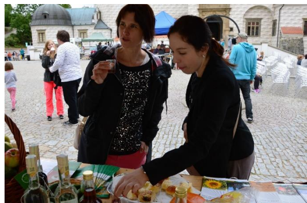
Obr. 12 Festival chutí, vůní a řemesel Pardubický Zámek, 12. – 14. 8. 2016

V roce 2016 byla zahájena intenzivní spolupráce se Statutárním městem Pardubice a Turistickým informačním centrem Pardubice (TIC Pardubice) v rámci příprav k založení destinačního spolku pro Turistickou oblast Pardubicko, kde MAS působí v roli spoluzakladatele. V prosinci 2016 proběhla v Lázních Bohdanči informační schůzka se zástupci města Pardubice a TIC Pardubice, na kterou byli přizváni také hlavní aktéři působící v oblasti cestovního ruchu a gastronomie na území Bohdanečska. Plán MAS zapojit se do této spolupráce byl následně odsouhlasen na zasedání Valné hromady MAS. V prvním čtvrtletí roku 2017 budou předloženy ke schválení materiály potřebné k založení daného spolku a samostatný vznik a zahájení činnosti spolku je plánován k 1. červenci 2017. Hlavním smyslem založení spolku je rozvoj cestovního ruchu a posílení komunikace mezi městem a venkovem. V srpnu roku 2016 proběhl