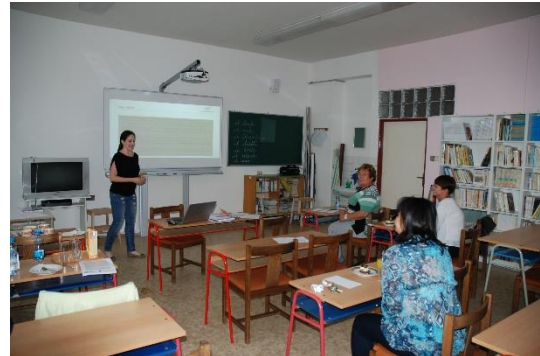
Obr. 3 Seminář pro školy v území MAS Bohdanečsko k výzvě na projekty zjednodušeného vykazování, Rohovládova Bělá, 19. 9. 2016

MAS Bohdanečsko realizovala v roce 2016 tzv. animaci škol. Jedná se o administrativní podporu mateřským a základním školám při podávání žádosti o dotaci z Operačního programu Výzkum, vývoj a vzdělávání. Cílem výzvy Podpora škol formou zjednodušeného vykazování – tzv. šablon je podpora základů vzdělávání rozvojem čtenářské a matematické gramotnosti, podpora kvalitnějšího vzdělávání dětí a žáků ohrožených školním neúspěchem a podpora společného vzdělávání. Školy mají možnost žádat o dotaci v termínu od 23. 6. 2016 do 30. 6. 2017. Doba trvání projektu je 24 měsíců. Dne 19. 9. 2016 se v ZŠ Rohovládova Bělá konal seminář pro školy v území. MAS Bohdanečsko uskutečňuje pravidelné osobní konzultace se školami v území MAS a v animační činnosti bude pokračovat i v roce 2017.