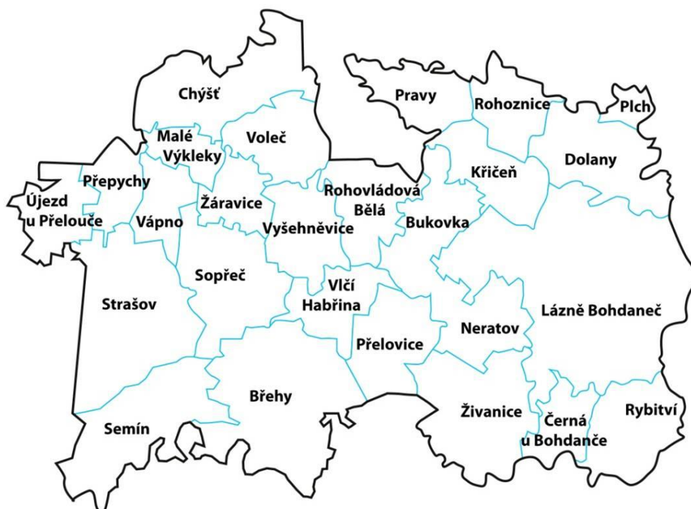
Obr. 1 Mapa území MAS Bohdanečsko

MAS Bohdanečsko je neziskovou organizací, která pracuje na principu metody LEADER. Metoda LEADER je založena na tzv. „přístupu zdola“ s tím, že rozhodovací pravomoc týkající se vypracování a provádění strategií místního rozvoje náleží právě místní akční skupině. Smyslem této metody je zapojit do spolurozhodování o rozvoji regionu aktéry, kteří v regionu žijí a vědí tak, co dané území potřebuje.