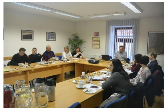
Obr. 8 Workshop – pracovní setkání MAS Jevíčko, 21. 12. 2017

MAS Bohdanečsko spolu s dalšími pěti místními akčními skupinami Pardubického kraje (MAS Litomyšlsko, o. p. s., MAS Holicko, o. p. s., MAS Skutečsko, Košumbersko a Chrastecsko, z.s., Místní akční skupina Svitava z.s. a MAS Moravskotřebovsko a Jevíčko o.p.s.) navázaly na spolupráci a dobrou praxi při výměně zkušeností z realizace projektu „Společné využití praxe v oblasti evaluace strategií“ realizovaného v letech 2014–2015 financovaného z PRV 2007–2013 zorganizováním 3 workshopů - pracovních setkání MAS (22. 7. 2016 ve Svitavách, 28. 6. 2016 v Luži a 21. 12. 2016 v Jevíčku) určených zaměstnancům kanceláří MAS. Obsahem těchto