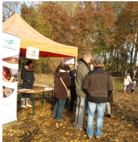
Obr. 11 Prezentace MAS na Výlovu Bohdanečského rybníka

V roce 2016 byla zahájena intenzivní spolupráce se Statutárním městem Pardubice a Turistickým informačním centrem Pardubice (TIC Pardubice) v rámci příprav k založení destinačního spolku pro Turistickou oblast Pardubicko, kde MAS působí v roli spoluzakladatele. V prosinci 2016 proběhla v Lázních Bohdanči informační schůzka se zástupci města Pardubice a TIC Pardubice, na kterou byli přizváni také hlavní aktéři působící v oblasti cestovního ruchu a gastronomie na území Bohdanečska. Plán MAS zapojit se do této spolupráce byl následně odsouhlasen na zasedání Valné hromady MAS. V prvním čtvrtletí roku 2017 budou předloženy ke schválení materiály potřebné k založení daného spolku a samostatný vznik a zahájení činnosti spolku je plánován k 1. červenci 2017. Hlavním smyslem založení spolku je rozvoj cestovního ruchu a posílení komunikace mezi městem a venkovem. V srpnu roku 2016 proběhl