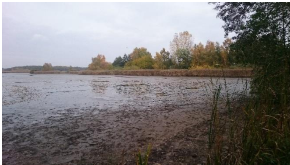
Obr. 10 Výlov Bohdanečského rybníka Lázně Bohdaneč, 28. 10. 2016

Dne 27. 10. 2016 se MAS Bohdanečsko účastnila Výlovu Bohdanečského rybníka. Pracovníci MAS zde návštěvníky informovali o činnosti MAS v území, možnostech spolupráce a plánovaných výzvách, v rámci kterých, bude možnost čerpat přes MAS finanční prostředky.