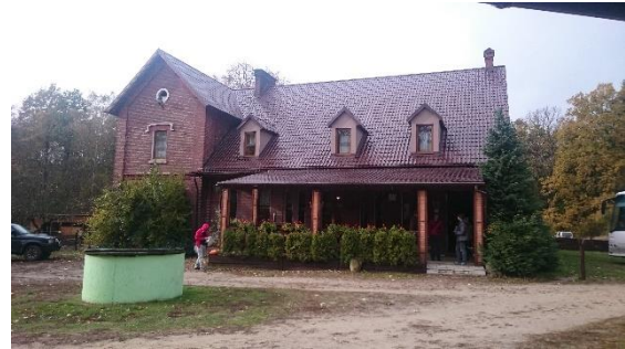
Obr. 9 Restaurace Hubertówka Zamek Mysliwski Polsko, 2. 11. 2016

Manažerka MAS se v roce 2016 zúčastnila LeaderFESTU, který se konal v Karlově Studánce v Jeseníkách. Na podzim roku 2016 se zaměstnanci kanceláře MAS zúčastnili Národní konference Venkov 2016, která proběhla v Litoměřicích. V listopadu 2016 se MAS Bohdanečsko společně s ostatními MAS Pardubického kraje zúčastnila exkurze do polské MAS (okolí města Milicz), která sloužila jako inspirace k čerpání finančních prostředků a byla určena nejen pro manažery a členy MAS, ale také pro starosty obcí, zemědělce, podnikatele a potencionální žadatele o dotace z Programu rozvoje venkova.